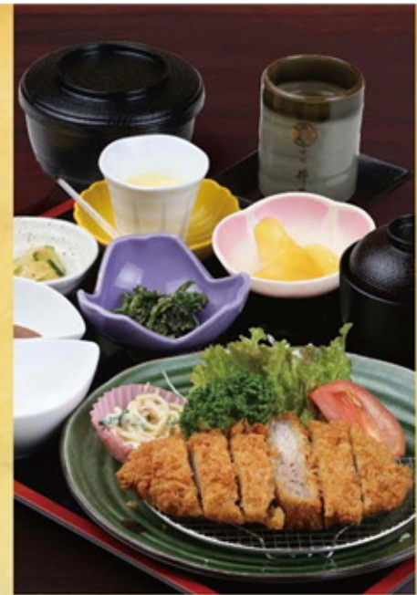
黒豚ローズかつ定食 1,400円