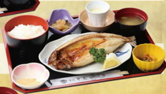
飛魚ひらき焼魚定食 980円