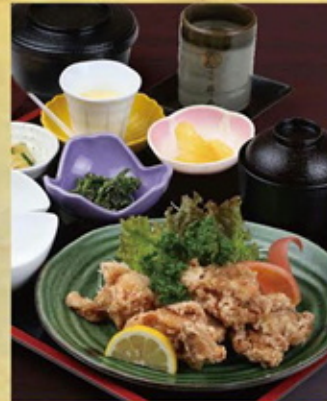
若鶏の唐揚げ定食 1,200円