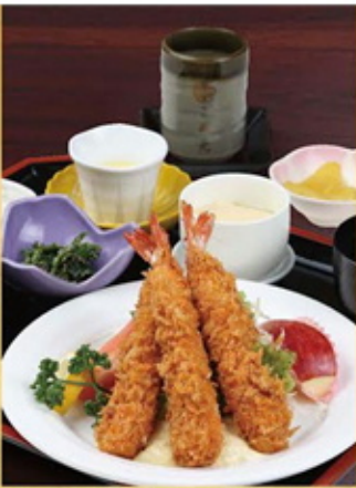
ジャンボ海老フライ定食 1,700円