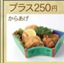
プラス250円 からあげ