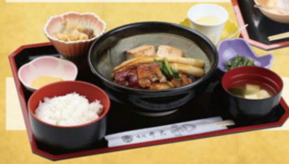
地魚あら炊き定食 1,800円

おにぎり、エビフライ、ハンバーグ、唐揚げ、 ウインナー、たこ焼き、アメリカンドッグ、 デザート、ジュース等お子様の大好きな メニューを揃えました！