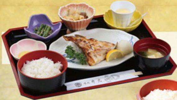
赤バラかま焼き定食 1,580円