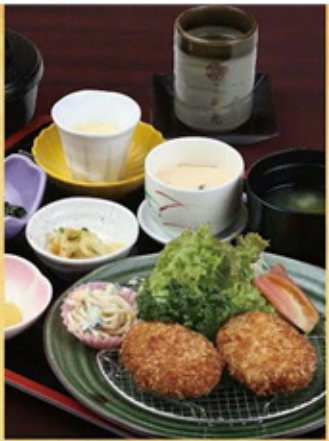
安納芋コロケ定食 1,100円