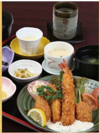
ミックスフライ定食 1,400円