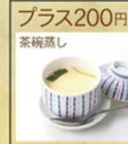
プラス200円 茶碗蒸し