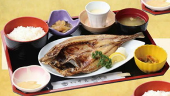
特大アジ開き定食 1,480円